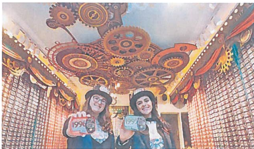
Hay negocios en Oporto que han reinventado sus productos para enfocarlos al turismo.