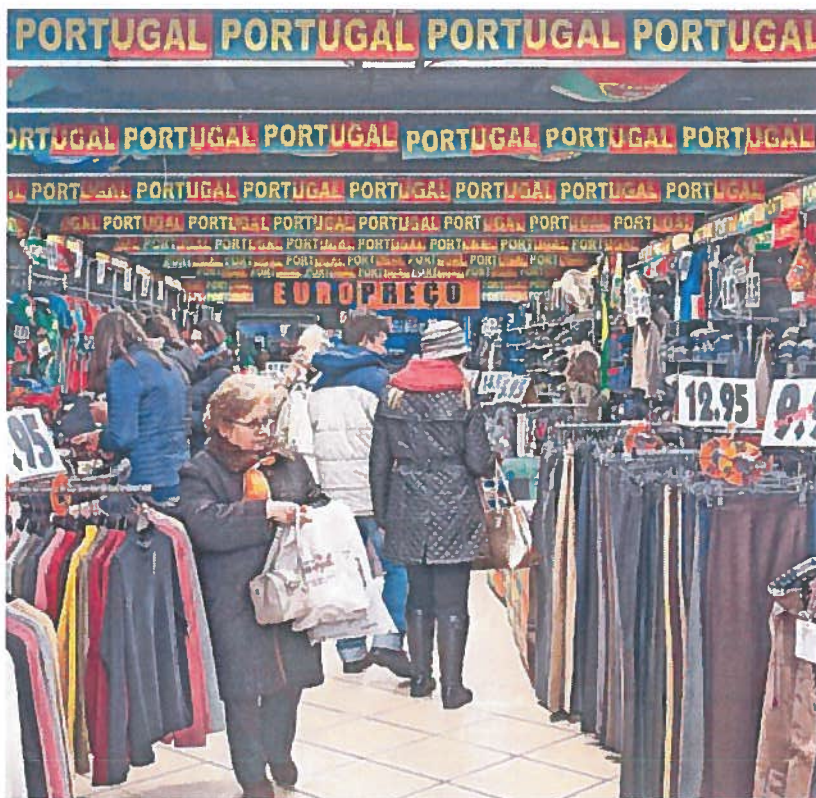
El consumo revive en Portugal, de la mano de las mejoras en sueldos y pensiones.

Mucho ha llovido desde entonces (aunque menos de lo que los arrasados montes lusos precisaban). Y Portugal ha dejado de ser el patito feo que fue para convertirse en el admirado cisne de la eurozona. Todo el mundo habla del milagro económico luso. Hasta el cenizo de Wolfgang Schäuble, el veterano político alemán que durante ocho años dominó que durante la crisis del euro desde el todopoderoso Ministerio de Finanzas germano, ha tenido que tragarse sus palabras. Y eso después de intentar hacer algo más de un año, sin éxito, abocar a los portugueses a un nuevo rescate por la desobediencia del Gobierno socialista de António Costa a los